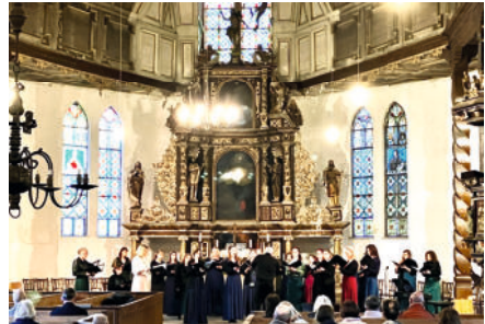
Konzert des Vocalensembles Phonova aus Wernigerode in St. Johannis