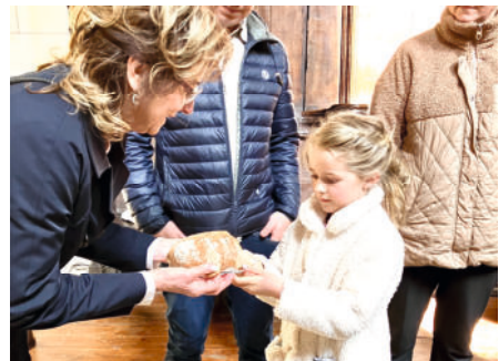
Zum Abschluss des Gottesdienstes auf dem Weg am Ostermontag wurde gemeinsam Agapemahl gefeiert und das Brot miteinander geteilt.