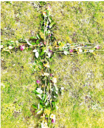
Ein Kreuz aus Blumen als Zeichen der Hoffnung und des Neubeginns, gelegt von Groß und Klein, am Ostermontag beim Gottesdienst auf dem Weg.