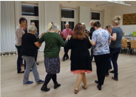
Folktauz im Bonifatiusaal.