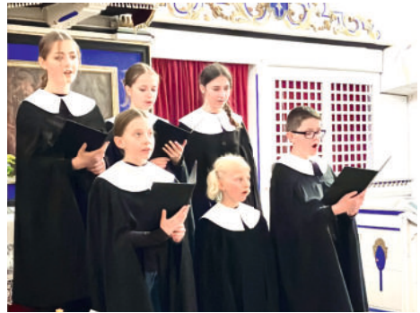
Kurrendekinder gestalten den Gottesdienst mit