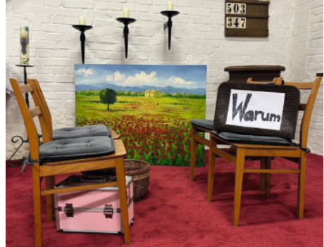
Osterspiel in Langenstein