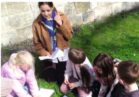
Vorbereitung auf die Aufnahmeprüfung

Bei den Pfadfinderinnen und Pfadfindern unserer Kirchengemeinde ist inzwischen die Wölflingsgruppe die stärkste geworden. Am 9. Mai machten wir einen Aktionstag mit Wanderung, Aufnahme und Halstuchverleihung. Die jugendlichen Teamer führten die Wölflinge durchs Gelände von Langenstein nach Halberstadt, während die älteren Ranger-Rover im Lager alles vorbereiteten. „Das war schon manchmal ein bisschen knifflig“, sagte eine Teamerin „aber letztlich konnten wir uns auf die Kinder verlassen. Und sie sich auf uns.“ Glücklich angekommen gab es ein zünftig pfadfinderisches Mahl am