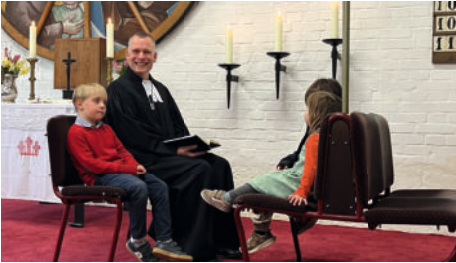
Gottesdienst mit Osterspiel Langenstein