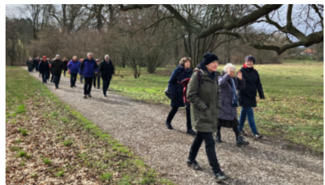
Grünkohlwanderung in Langenstein mit reger Beteiligung aus allen Gemeindeteilen und anschließendem Schmaus im Pfarrhaus