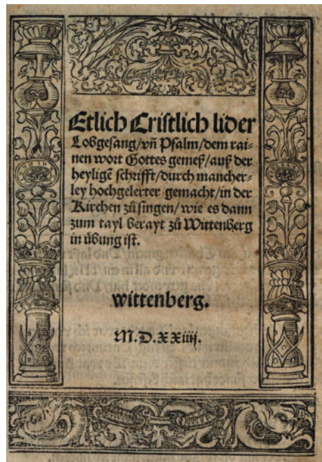
Das Achtliederbuch von 1524 gilt als erstes evangelisches Gesangbuch

sangbuch. Heute ist das EG als Gottesdienst- und Hausbuch in allen deutschsprachigen evangelischen Gemeinden (auch in Österreich und im Elsass) verbreitet. Es ist ein lebendiges Werk, das sich kontinuierlich weiterentwickelt hat, um die Vielfalt des Glaubens und der musikalischen Ausdrucksformen widerzuspie-