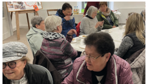
Jung und Alt beim Kaffee in der Winterkirche Sargstedt

Unter dem Motto „Unsere Kirche lebt!“ stand der erste Trödelmarkt in der St. Stephani Kirche in Sargstedt am 20.04. Zwar hatte uns das Regenwetter einen kleinen Strich durch die Rechnung gemacht, aber wir öffneten schnell das Kirchenportal und alle Freizeithändler konnten ihre Boden- und Kellerfunde in unserer Kirche für den Handel vorbereiten. Reges Treiben herrschte vor dem Altar und in den Gängen und so manche Waren wechselten ihre Besitzer. Historisch Interessierte kamen ebenfalls auf ihre Kosten. Für das leibliche Wohl der Gäste und der „Trödler“ sorgten Kaffee, Tee und Kuchen in unserer Winterkirche. Ein rundum gelungener Kirchennachmittag, mit gemütlichem Beisammensein und zum Wohle der Gemeinschaft! Der GKR Sargstedt