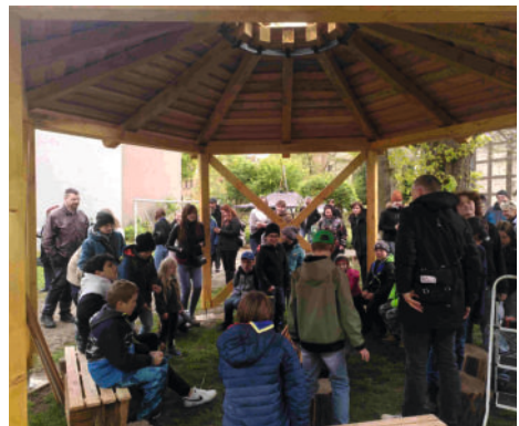
Tag der Offenen Jurte des Pfadfinderstammes „Harzer Luchse“ mit Eröffnung der neuen Schutzhütte