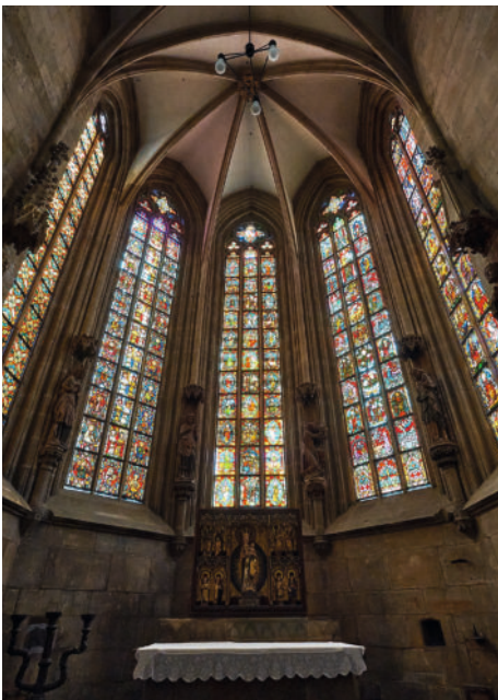
Marienkapelle im Halberstädter Dom

Führung durch Dom und Domschatz Voranmeldung und Ticket in der Tourist In- formation Halberstadt