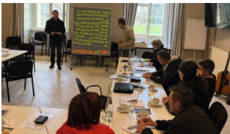
Gemeindeklausurtag mit dem GKR und anderen Mitarbeitenden im Kloster Hedersleben