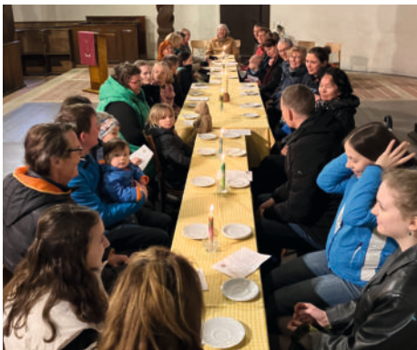
Passionsandacht für Familien in der Johannis-kirche mit anschließendem Basteln und Beisammensein