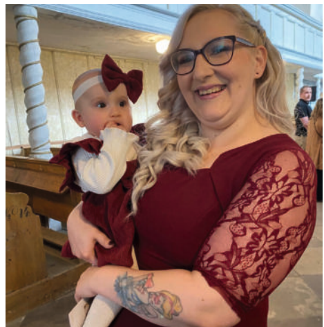
Kleiner Täufling in Danstedt

Unter dem Motto „Unsere Kirche lebt!“ stand der erste Trödelmarkt in der St. Stephani Kirche in Sargstedt am 20.04. Zwar hatte uns das Regenwetter einen kleinen Strich durch die Rechnung gemacht, aber wir öffneten schnell das Kirchenportal und alle Freizeithändler konnten ihre Boden- und Kellerfunde in unserer Kirche für den Handel vorbereiten. Reges Treiben herrschte vor dem Altar und in den Gängen und so manche Waren wechselten ihre Besitzer. Historisch Interessierte kamen ebenfalls auf ihre Kosten. Für das leibliche Wohl der Gäste und der „Trödler“ sorgten Kaffee, Tee und Kuchen in unserer Winterkirche. Ein rundum gelungener Kirchennachmittag, mit gemütlichem Beisammensein und zum Wohle der Gemeinschaft! Der GKR Sargstedt