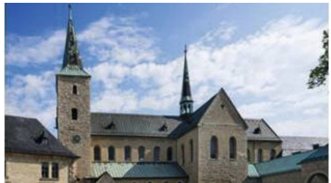
Das Ziel der Zweiten Genussradtour: das Kloster Huysburg

Ab 9 Uhr Treffen an der Kirche und Anmeldung. 10:00 Uhr Beginn mit einem „Wort auf den Weg“ von GMP Christian Lontzek und Start zum Kloster Huysburg über Sargstedt und Aspenstedt. 12-13:30 Uhr Mittagspause auf dem Gelände des Klosters Huysburg (Besichtigung und Verpflegung im Kloster-Café möglich). Ca. 14:30 Uhr Abschluss im Kirchgarten St. Moritz mit Kirchenkaffee, Kuchenbasar und Grill.