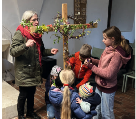
„Gottesdienst unterwegs“ am Ostermontag, hier die Station mit dem Schmücken des Kreuzes in der Winterkirche