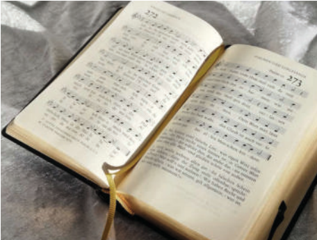
Alt und neu: eines der ersten Lutherlieder im modernen Gesangbuch mit Ledereinband und Goldschnitt.

gelischen Gesangbuchs feiern und immer noch neue Lieder darin entdecken, wird schon lange an einer neue Ausgabe gearbeitet, die wohl in den 30er Jahren erscheinen soll. Anregungen dazu bitte an: impulsegesangbuch@ekd.de