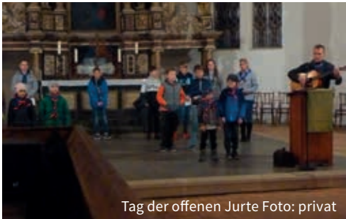
Tag der offenen Jurte