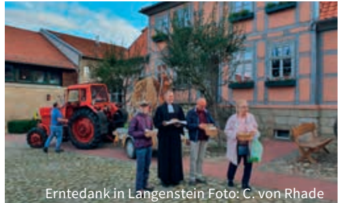
Erntedank in Langenstein