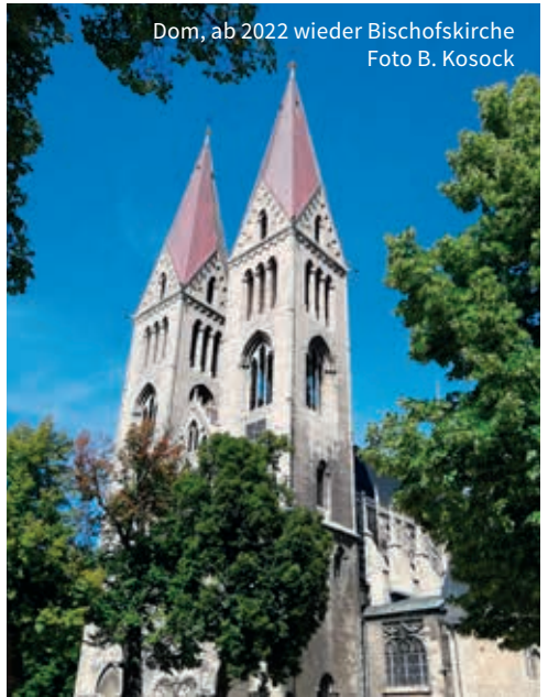
Dom, ab 2022 wieder Bischofskirche