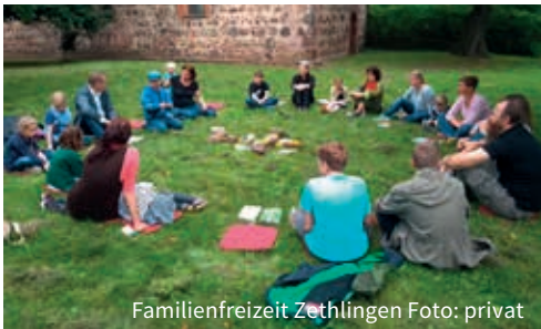
Familienfreizeit Zethlingen