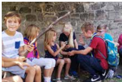
Pfadfinder lernen den Gruß, Foto: A. Kaus

mit etwas Kaminholz oder einer Tüte Marshmallows? Auch eine Isomatte oder ein Schlafsack für die Gruppe wären toll, denn es gibt immer mal jemanden, der das gerade nicht hat. In unserem Stamm sind inzwischen fast 30 eingetragene Mitglieder im VCP (Verband Christlicher Pfadfinderinnen und Pfadfinder), dazu noch die Kinder, die ohne Halstuch dabei sind. Die Termine für die Stammestreffen geben wir intern weiter. Wer mitmachen möchte, einfach mal bei Pfarrer Kaus anrufen.