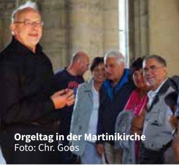
Orgeltag in der Martinikirche