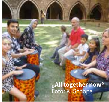
„All together now“