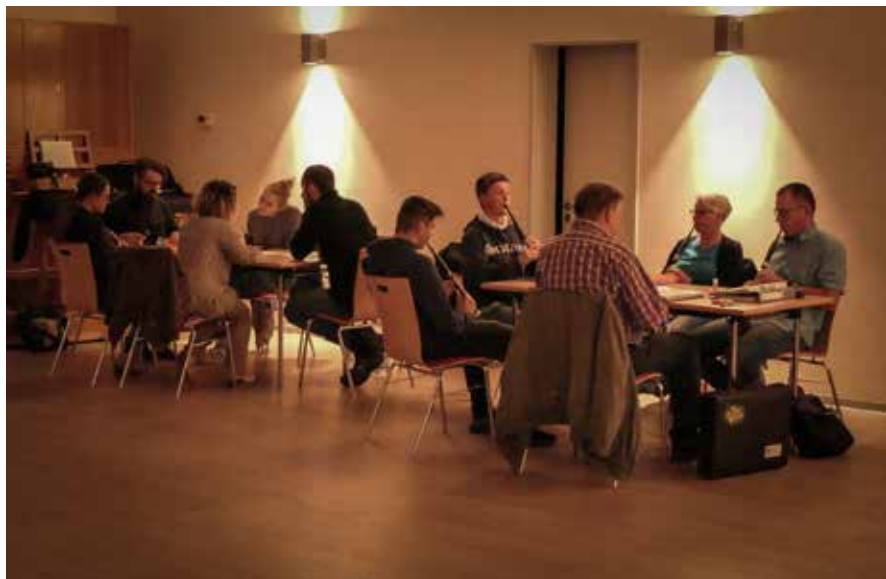
Neue Dudelsack-Gruppe, Foto: Maik Grundmann