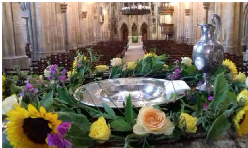
Taufstein im Dom

Als Gemeinde freuen wir uns mit den Fröhlichen und trauern für die Traurigen. Wir wünschen allen Getauften, Getrauten und Konfirmierten alles Gute und bitten Gott um Segen für die Verstorbenen und ihre Angehörigen. Weil wir den Datenschutz ernst nehmen, veröffentlichen wir hier aber keine Namen.