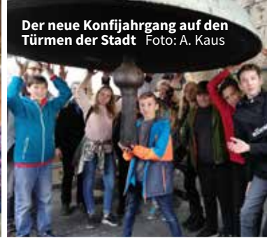
Der neue Konfijahrgang auf den Türmen der Stadt