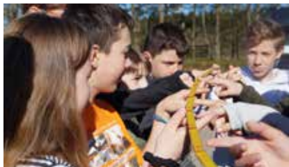
Konfis in St. Andreasberg, Foto: B. Löhr