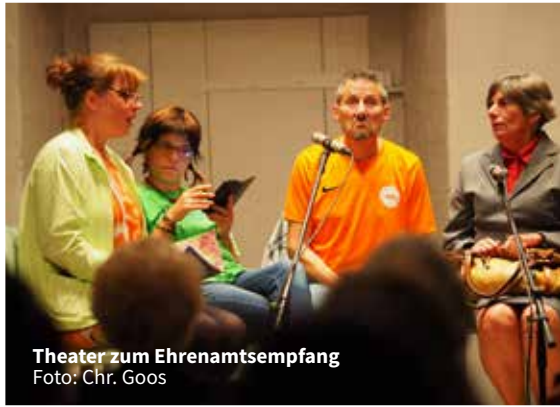
Theater zum Ehrenamtsempfang