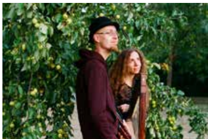
Duo Harfe und Dudelsack