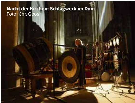
Nacht der Kirchen: Schlagwerk im Dom