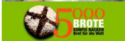
Konfis backen Brot