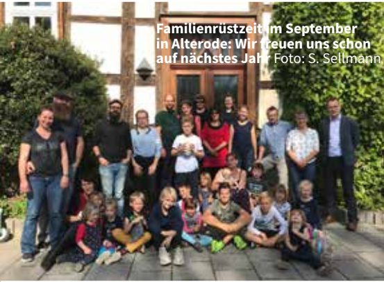
Familienrüstzeit im September in Alterode: Wir freuen uns schon auf nächstes Jahr