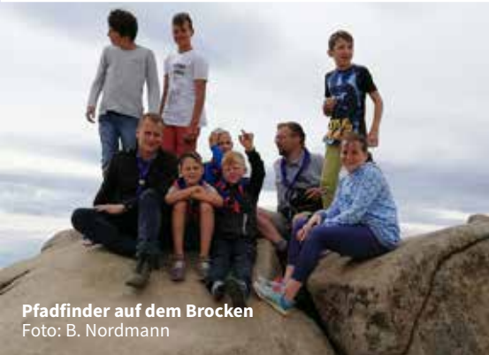
Pfadfinder auf dem Brocken